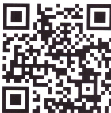
QR-код канала Родительской школы